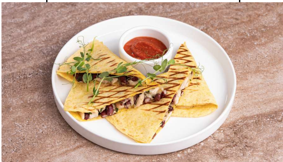
КЕСАДИЛЬЯ с курицей и фасолью Chicken and Bean Quesadilla