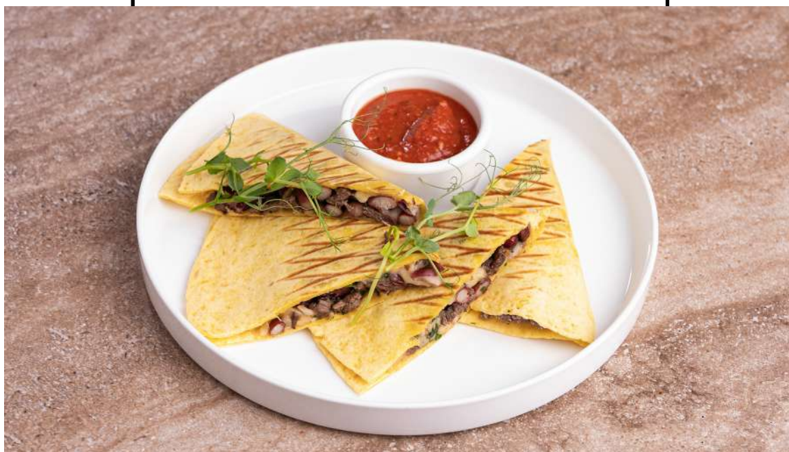
КЕСАДИЛЬЯ с говядиной и фасолью Beef and Bean Quesadilla